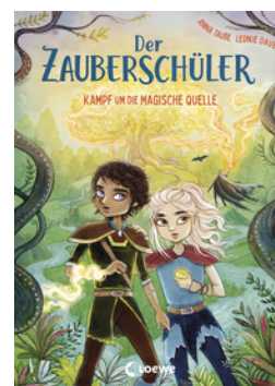
Der Zauberschüler (Band 4) - Kampf um die Magische Quelle