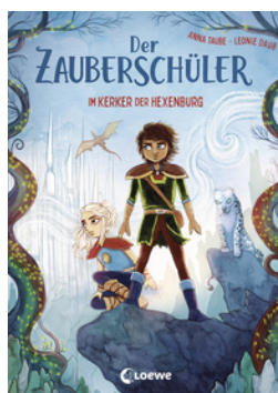
Der Zauberschüler (Band 5) - Im Kerker der Hexenburg