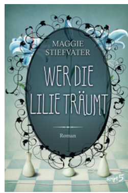
Wer die Lilie träumt (Band 2)