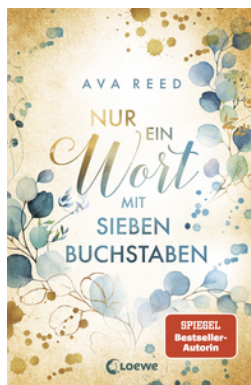
Nur ein Wort mit sieben Buchstaben