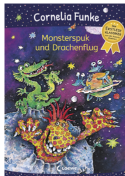
Monsterspuk und Drachenflug