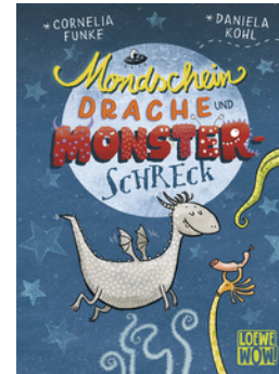
Mondscheindrache und Monsterschreck