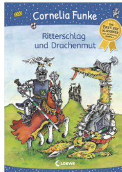
Ritterschlag und Drachenmut