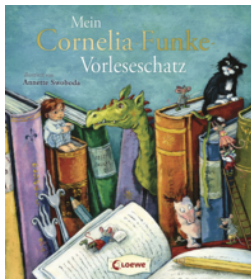
Mein Cornelia-Funke- Vorleschatz