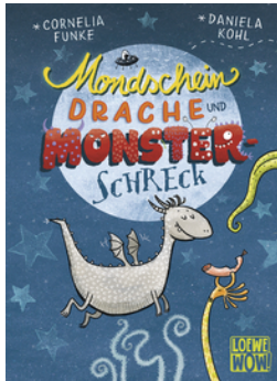
Mondscheindrache und Monsterschreck