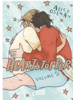
Heartstopper Volume 5 (deutsche Hardcover-Ausgabe)