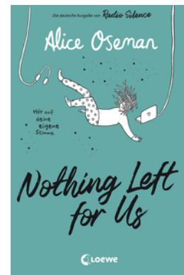
Nothing Left for Us (deutsche Ausgabe von Radio Silence)