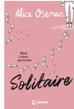
Solitaire (deutsche Ausgabe)