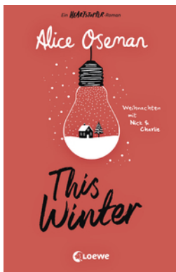
This Winter (deutsche Ausgabe)