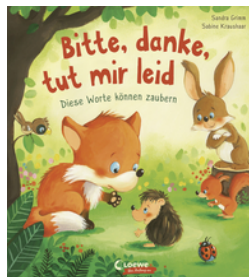
Bitte, danke, tut mir leid