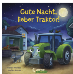
Gute Nacht, lieber Traktor!