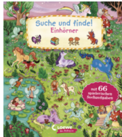
Suche und finde! Einhörner