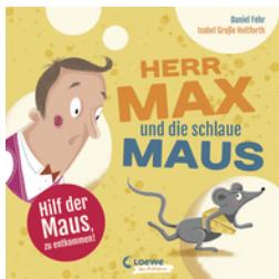
Herr Max und die schlaue Maus