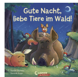
Gute Nacht, liebe Tiere im Wald!