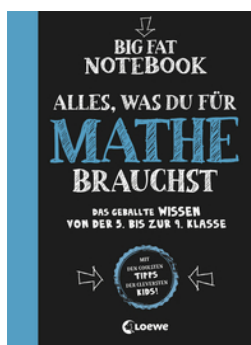
Big Fat Notebook - Alles, was du für Mathe brauchst - Das geballte Wissen von der 5. bis zur 9. Klasse