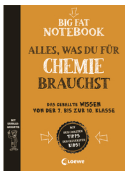
Big Fat Notebook Chemie - Alles, was du für Chemie brauchst - Das geballte Wissen von der 7. bis zur 10. Klasse