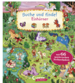
Suche und finde! Einhörner