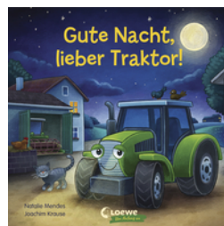
Gute Nacht, lieber Traktor!