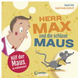
Herr Max und die schlaue Maus