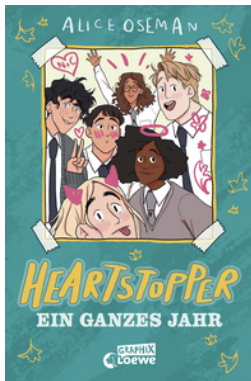
Heartstopper - Ein ganzes Jahr (Yearbook)