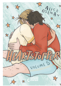
Heartstopper Volume 5 (deutsche Hardcover-Ausgabe)