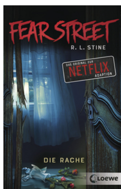
Fear Street - Die Rache