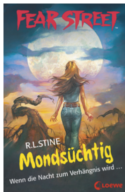
Fear Street 57 - Mondsüchtig