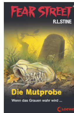
Fear Street 58 - Die Mutprobe