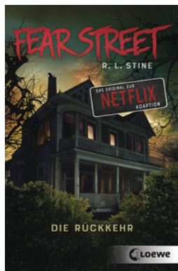
Fear Street - Die Rückkehr