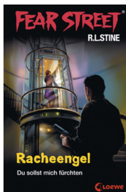
Fear Street 60 - Racheengel