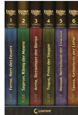
Beast Quest (Band 1-6)