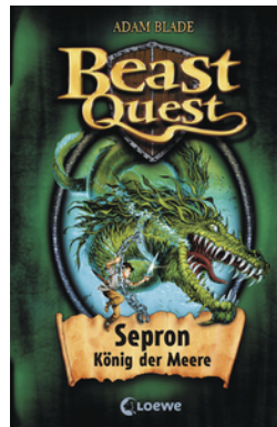
Beast Quest (Band 2) - Sepron, König der Meere