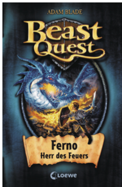
Beast Quest (Band 1) - Ferno, Herr des Feuers