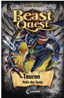
Beast Quest (Band 66) - Tauron, Hufe des Zorns