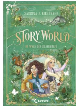
StoryWorld (Band 2) - Im Wald der Silberwölfe