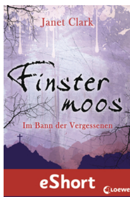
Finstermoos – Im Bann der Vergessenen