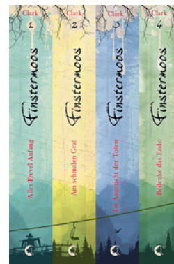
Finstermoos - Die komplette Reihe inkl. eShort