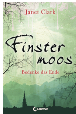
Finstermoos – Bedenke das Ende