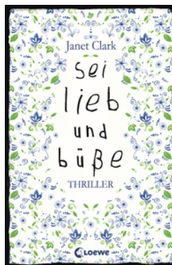
Sei lieb und büße