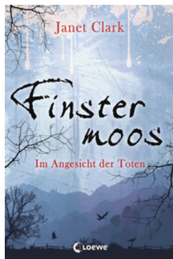
Finstermoos – Im Angesicht der Toten