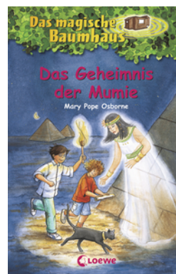
Das magische Baumhaus (Band 3) - Das Geheimnis der Mumie