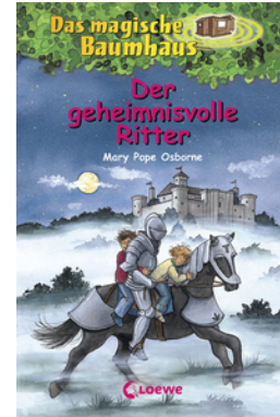
Das magische Baumhaus (Band 2) - Der geheimnisvolle Ritter