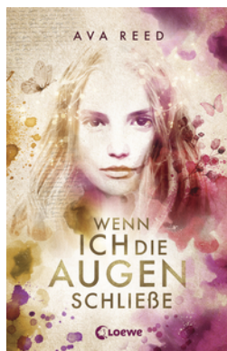
Wenn ich die Augen schließe