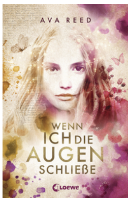
Wenn ich die Augen schließe