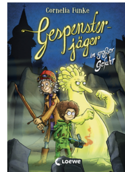
Gespensterjäger in großer Gefahr