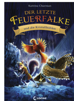
Der letzte Feuerfalk und die Kristallhöhlen (Band 2)