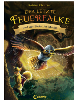
Der letzte Feuerfalk und der Stein der Macht (Band 1)