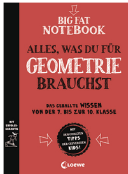
Big Fat Notebook - Alles, was du für Geometrie brauchst