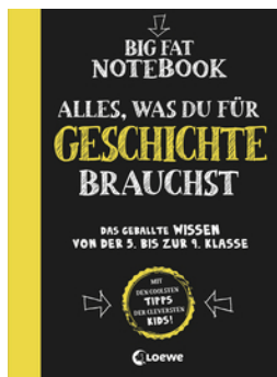
Big Fat Notebook - Alles, was du für Geschichte brauchst