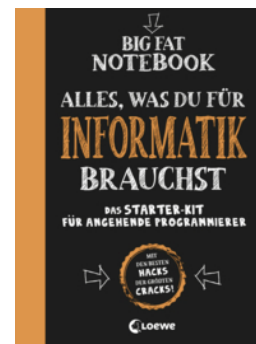
Big Fat Notebook - Alles, was du für Informatik brauchst - Das Starterkit für angehende Programmierer