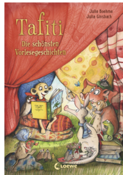
Tafiti - Die schönsten Vorlesegeschichten