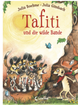
Tafiti und die wilde Bande (Band 20)