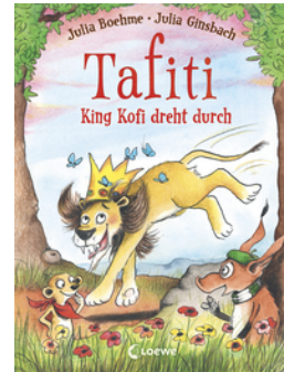
Tafiti - King Kofi dreht durch (Band 21)