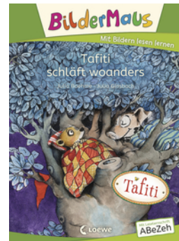
Bildermaus - Tafiti schläft woanders