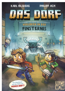
Das Dorf (Band 6) - Verloren in der Finsternis