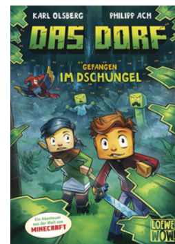
Das Dorf (Band 3) - Gefangen im Dschungel