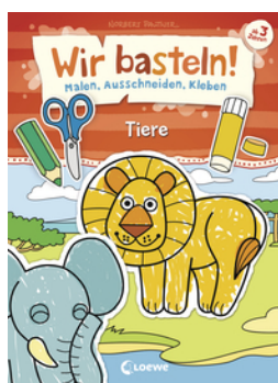
Wir basteln! - Malen, Ausschneiden, Kleben - Tiere