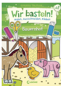
Wir basteln! - Malen, Ausschneiden, Kleben - Bauernhof