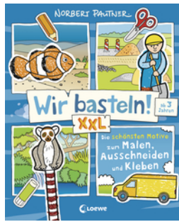
Wir basteln! XXL - Die schönsten Motive zum Malen, Ausschneiden und Kleben (blau)