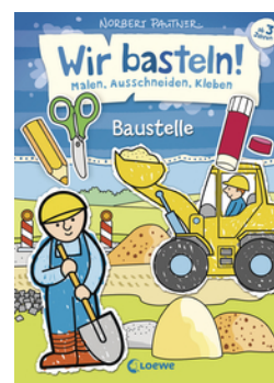
Wir basteln! - Malen, Ausschneiden, Kleben - Baustelle