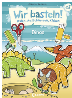
Wir basteln! - Malen, Ausschneiden, Kleben - Dinos