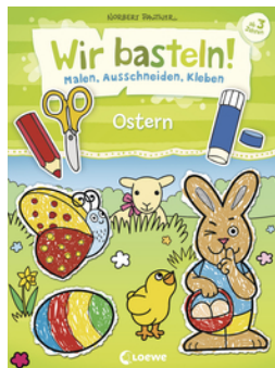
Wir basteln! - Malen, Ausschneiden, Kleben - Ostern