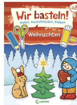
Wir basteln! - Malen, Ausschneiden, Kleben - Weihnachten