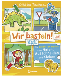
Wir basteln! XXL - Die schönsten Motive zum Malen, Ausschneiden und Kleben (gelb)