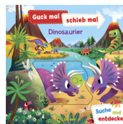
Guck mal, schieb mal! Suche und entdecke - Dinosaurier