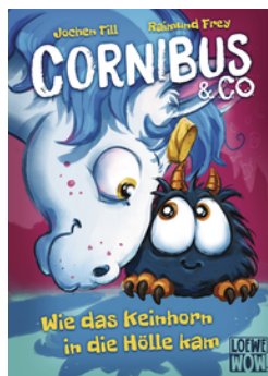
Cornibus & Co. (Band 4) - Wie das Keinhorn in die Hölle kam