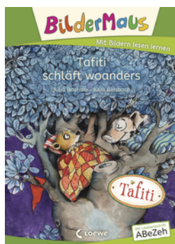
Bildermaus - Tafiti schläft woanders