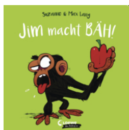
Jim macht bäh!