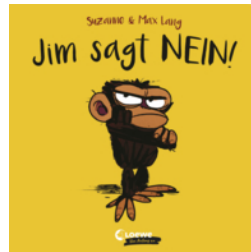
Jim sagt Nein!