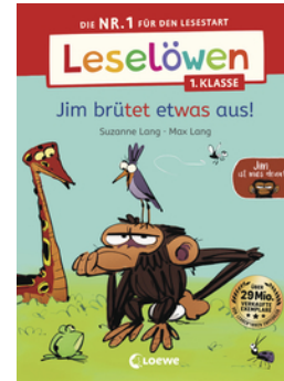
Leselöwen 1. Klasse - Jim ist mies drauf - Jim brütet etwas aus!