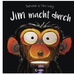
Jim macht durch