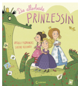
Die allerbeste Prinzessin