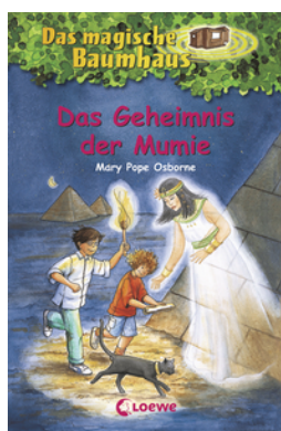
Das magische Baumhaus (Band 3) - Das Geheimnis der Mumie