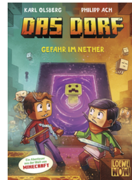
Das Dorf (Band 2) - Gefahr im Nether