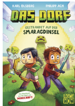
Das Dorf (Band 1) - Gestrandet auf der Smaragdinsel