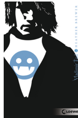
Vladimir Tod beisst sich durch (Band 2)