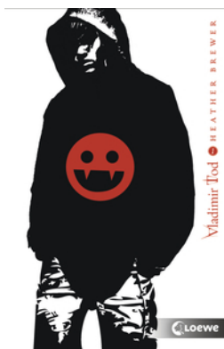
Vladimir Tod hat Blut geleckt (Band 1)