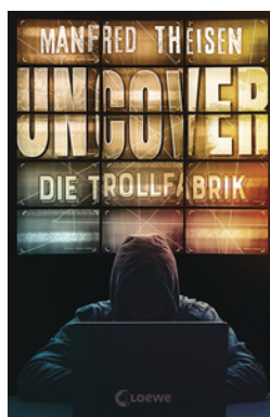
Uncover - Die Trollfabrik