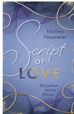
Script of Love - Mit jedem deiner Blicke (Love-Trilogie, Band 2)