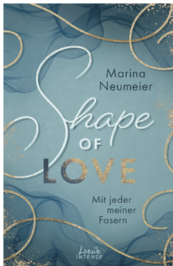
Shape of Love - Mit jeder meiner Fasern (Love-Trilogie, Band 1)