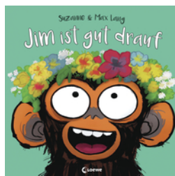
Jim ist gut drauf