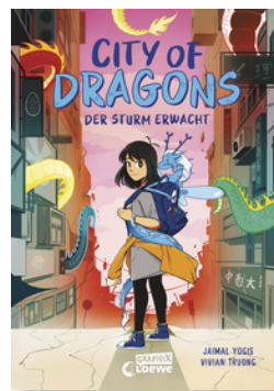
City of Dragons (Band 1) - Der Sturm erwacht