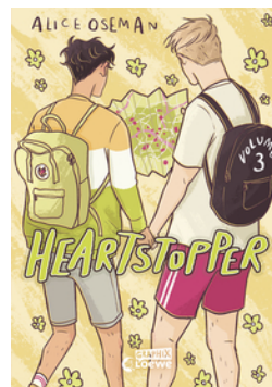
Heartstopper Volume 3 (deutsche Ausgabe)