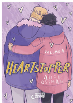
Heartstopper Volume 4 (deutsche Hardcover- Ausgabe)