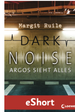
Dark Noise - Argos sieht alles