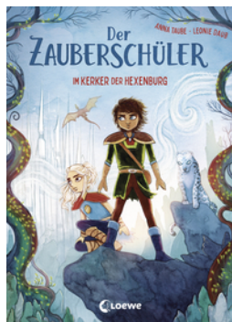
Der Zauberschüler (Band 5) - Im Kerker der Hexenburg