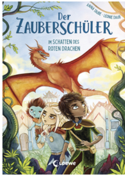
Der Zauberschüler (Band 3) - Im Schatten des roten Drachen