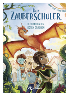
Der Zauberschüler (Band 3) - Im Schatten des roten Drachen