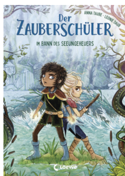
Der Zauberschüler (Band 2) - Im Bann des Seeungeheuers