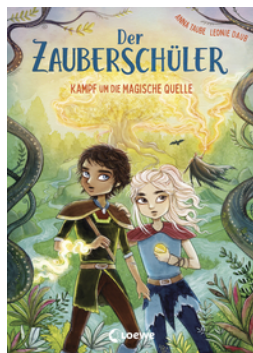
Der Zauberschüler (Band 4) - Kampf um die Magische Quelle