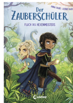
Der Zauberschüler (Band 1) - Fluch des Hexenmeisters