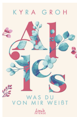
Alles, was du von mir weißt (Alles-Trilogie, Band 2)