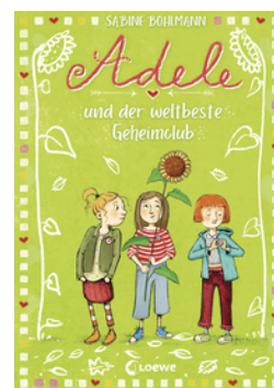
Adele und der weltbeste Geheimclub (Band 3)