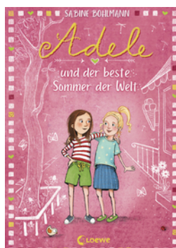
Adele und der beste Sommer der Welt (Band 2)