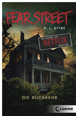
Fear Street - Die Rückkehr