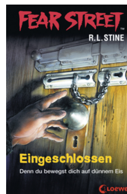
Fear Street 53 - Eingeschlossen