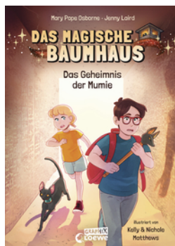
Das magische Baumhaus (Comic-Buchreihe, Band 3) - Das Geheimnis der Mumie