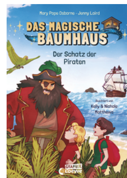
Das magische Baumhaus (Comic-Buchreihe, Band 4) - Der Schatz der Piraten