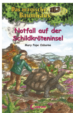
Das magische Baumhaus (Band 62) - Notfall auf der Schildkröteninsel