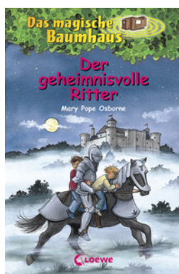
Das magische Baumhaus (Band 2) - Der geheimnisvolle Ritter