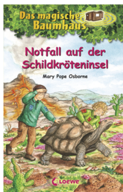
Das magische Baumhaus (Band 62) - Notfall auf der Schildkröteninsel