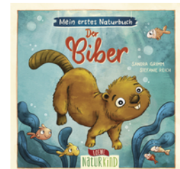
Mein erstes Naturbuch - Der Biber