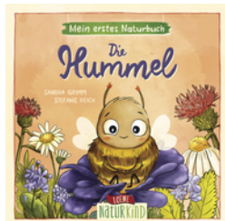
Mein erstes Naturbuch - Die Hummel