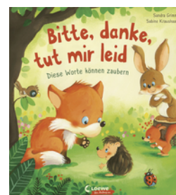
Bitte, danke, tut mir leid