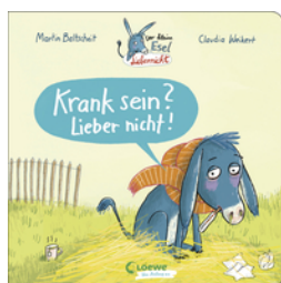
Der kleine Esel Liebernicht - Krank sein? Lieber nicht!