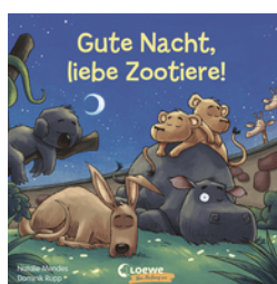
Gute Nacht, liebe Zootiere!