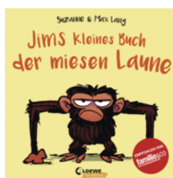
Jims kleines Buch der miesen Laune