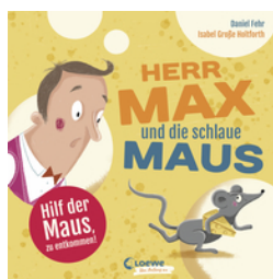
Herr Max und die schlaue Maus