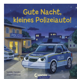
Gute Nacht, kleines Polizeiauto!