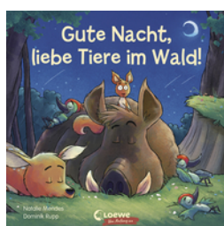
Gute Nacht, liebe Tiere im Wald!