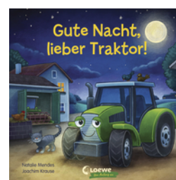
Gute Nacht, lieber Traktor!