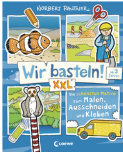
Wir basteln! XXL - Die schönsten Motive zum Malen, Ausschneiden und Kleben (blau)