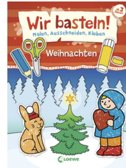
Wir basteln! - Malen, Ausschneiden, Kleben - Weihnachten