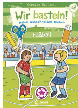
Wir basteln! - Malen, Ausschneiden, Kleben - Fußball