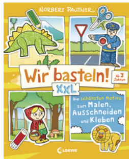
Wir basteln! XXL - Die schönsten Motive zum Malen, Ausschneiden und Kleben (gelb)