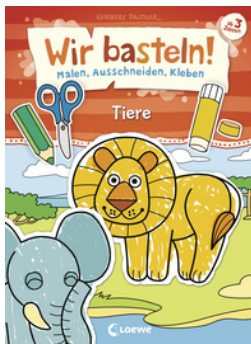
Wir basteln! - Malen, Ausschneiden, Kleben - Tiere