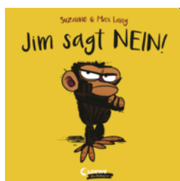
Jim sagt Nein!